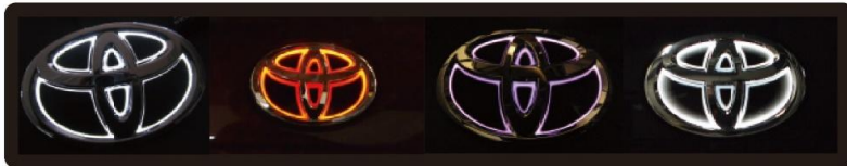
スリムライン:ホワイト LEDカラー:ホワイト スリムライン:レッド LEDカラー:レッド スリムライン:ピンク LEDカラー:ホワイト シナジーライン:ホワイト LEDカラー:ホワイト