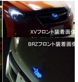
XVフロント装着画像