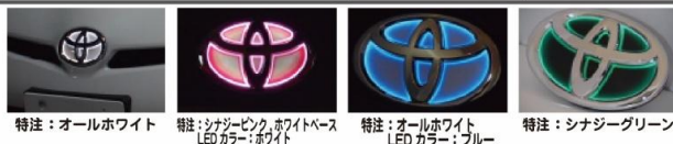
特注:オールホワイト LEDカラー:ホワイト 特注:シナジーピンク、ホワイトベース LEDカラー:ホワイト 特注:オールホワイト LEDカラー:ブルー 特注:シナジーグリーン