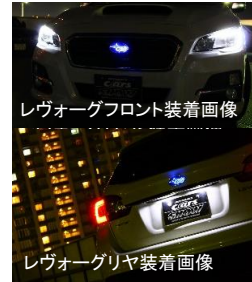
レヴォーグフロント装着画像